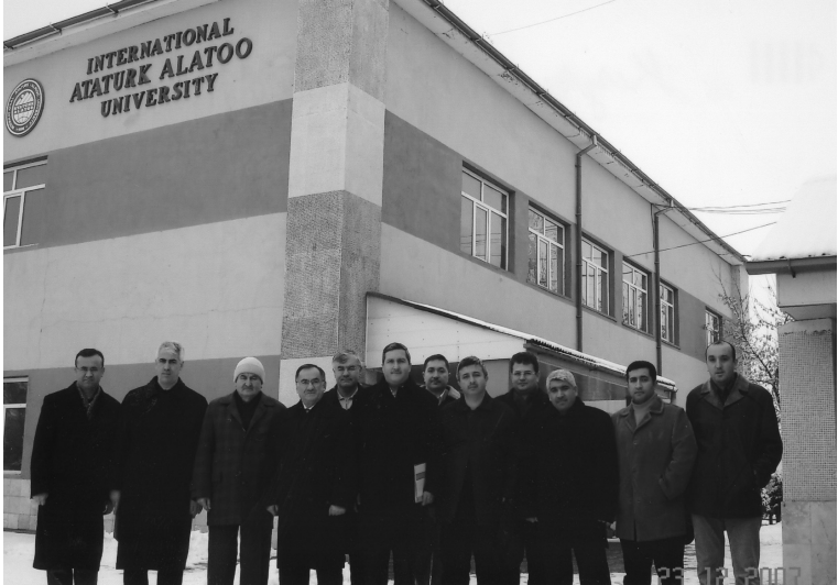
Kazakistan Bışkek'te Atatürk Alattoo Üniversitesi önünde rektör, Türk Heyeti ve diđer eğitimciler (Bışkek, 2005)

Milli Eğitim Bakanı Turan Tayan'ın Başkanlığında 1995-1996 öğretim yılı sonunda Kırgızistan'da Bakanlıkça açılan okullarımızın mezuniyet törenine katılmak üzere bir heyetle Kırgızistan'a gittik.