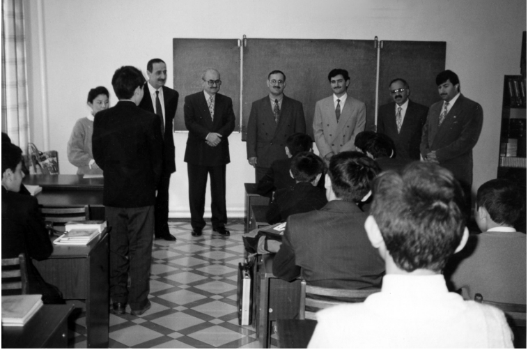
Türk eğitim heyeti Pakistanlı eğitimcilerle beraber (Karaçi 1999)

Uzun uğraşlar sonunda çocuklar bu halhların üzerine basılabileceğini öğrenmişler.