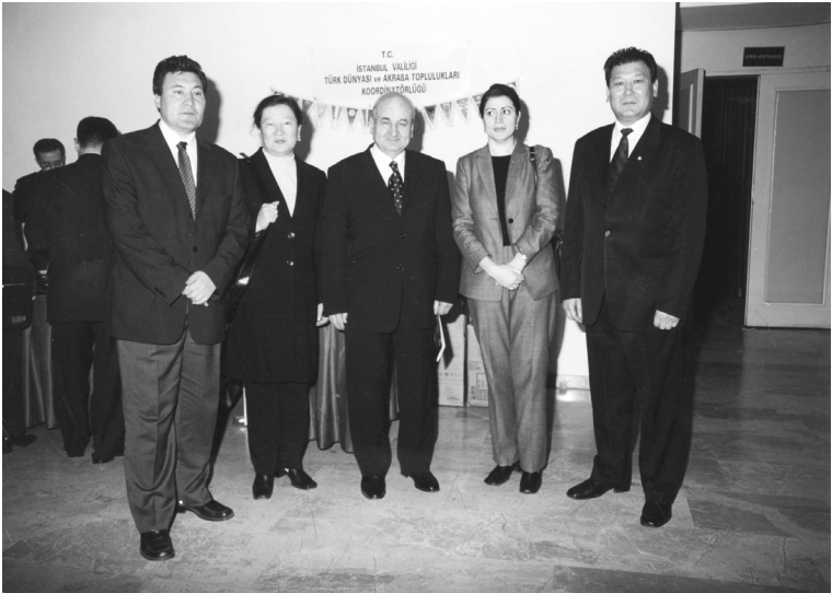
Türk Cumhuriyetlerinden gelip Türkiye'deki Üniversitelerde öğrenim gören öğrencilerin temsilcileri (Türkmenistan, Kırgızistan, Azerbaycan, Kazakistan) (Aşgabat 1998)