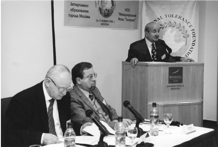
Moskova'da Tolerans Vakfı toplantısı. (Ocak 2002)