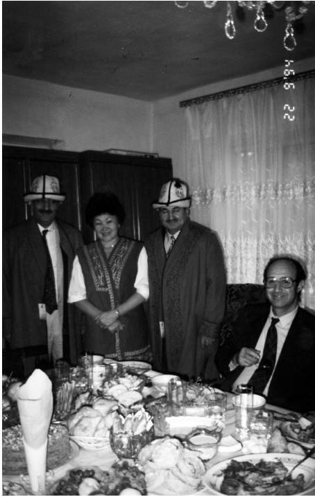
Aytaç, Kazakistan'dan Eğitim Başkanı, Kazakistan Eğitim Müşaviri, Türkiye M. Eğitim Bakanlığı Müsteşarı yardımcısı ile bir yemekte. (Almata 1997)

Kazakistan'da Eğitim Bakanlığınca okul açılması dileği eğitim işbirliği protokollerinde dile getirilmişse de uygulamaya konulamadı. Yine de gayretler boşa gitmedi. Öncelikle bir Türkçe eğitim merkezi açıldı. Ardından özel okullar bir bir geldi.