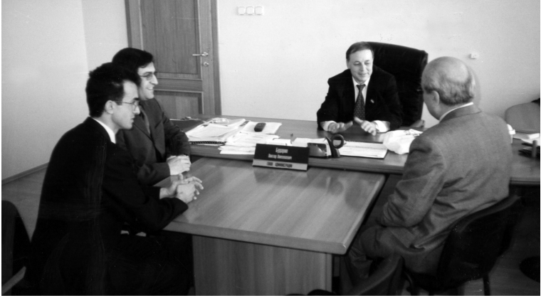
Türk heyeti Yakutistan Eğitim Bakanlığı müsteşarı ile birlikte (Yakutsk 1993)