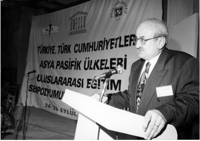
Türk Cumhuriyetleri Eğitim Sempozyumu (Türkmenistan 2000)