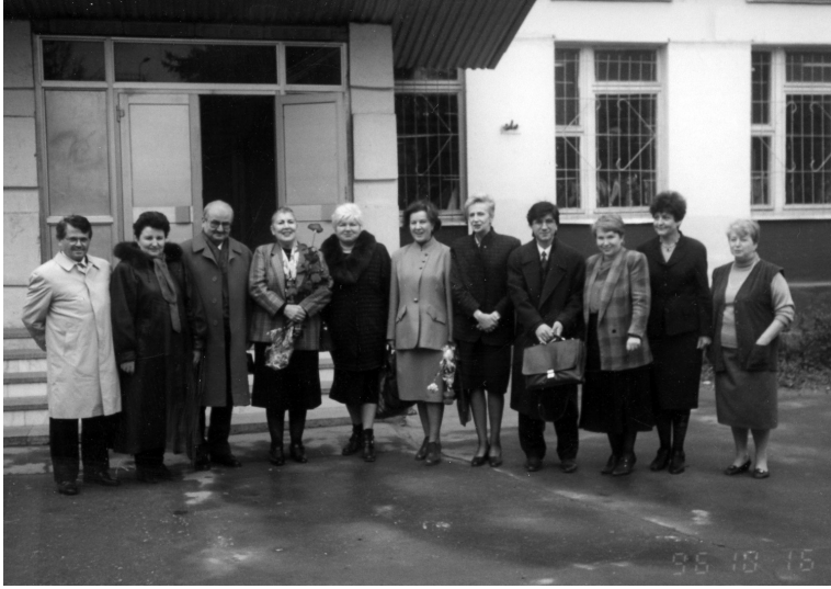
Moskova'daki bir okul ziyareti, Türk ve Rus Eğitimciler (1998)