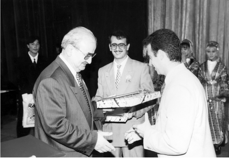
Moğolistan, Manhatu'da mezuniyet töreninde (2002)

Vali, bu başarılı sonucun alınmasında öğrencilerle yakından ilgilenen ağabey ve ablalarından da söz etti, ayrıca onlara da teşekkür etti.