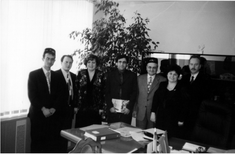
Türk eğitimciler Endonezalı eğitimcilerle birlikte (Cakarta, 2005)

İki okuldan özellikle birisinin çok güzel yapıldığını ve donatıldığını gördüm.